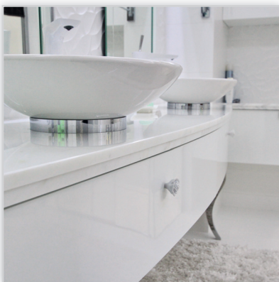
Blat łazienkowy z marmuru Bianco Carrara, wycinany w łuk, krawędź wykończona frezem ozdobnym. Do kompletu w łazience wykonano również zabudowę marmurową spłuczki podtynkowej oraz parapety okienne. Całość realizacji dostępna na stronie www.kominkiwaligora.pl