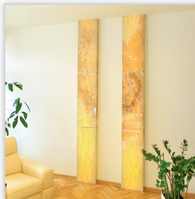
Lampy Onyx – słupy oświetleniowe wykonane z onyxu, podświetlenie LED z możliwością regulacji natężenia światła.