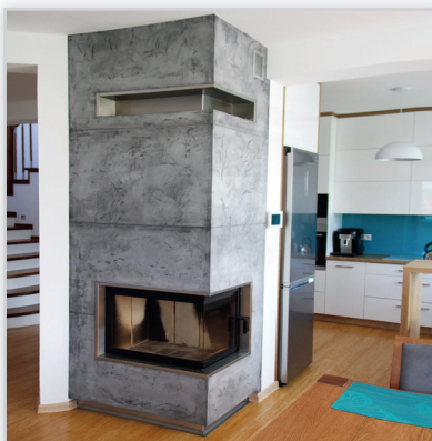
Hajduk Volcano 2P – wkład kominkowy firmy Hajduk w zabudowie imitującej beton architektoniczny – imitacja wykonana za pomocą stiuku woskowanego. Dzięki temu powierzchnia kominka jest nieporowata i łatwa w utrzymaniu. Wykończenie ramy oraz wylotu powietrza i cokołu ze stali nierdzewnej szczotkowanej.