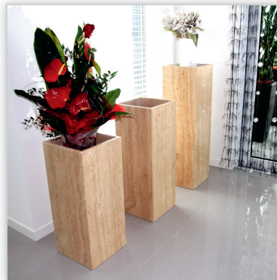
Donice kamienne – wykonane jako część większego projektu, w skład którego wchodzi kominek, część blatów użytkowych oraz ściana ozdobna. Całość z polerowanego trawertynu. Przewodni motyw drzewa towarzyszący realizacji został użyty jako tło ściany trawertynowej oraz kratki wentylacji kominka. Całość realizacji dostępna na stronie www.kominkiwaligora.pl