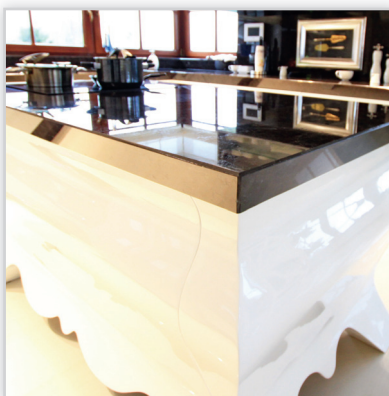
Blat kuchenny – wykonany z granitu, widoczna grubość blatu 10 cm, krawędź pod kątem 60° dopasowana do krzywizny mebla. W skład realizacji wchodzi blat kuchenny U-kształtny oraz wyspa.