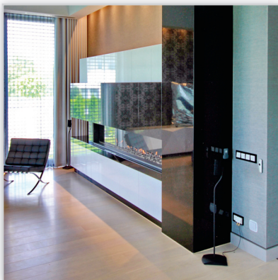
Kominek gazowy – wkład gazowy wykonany na zamówienie do tej konkretnej realizacji, szerokość wkładu 250 cm. Zabudowa wykonana z granitu Star Galaxy, białych elementów meblowych oraz spieku kwarcowego Laminam Filo Oro.