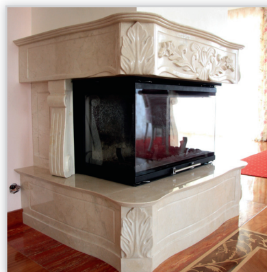
Wkład wodny trójstronny – wykonany specjalnie pod projekt, szymba w całości podnoszona do góry. Palenisko o mocy ~24 kW przystosowane do podłączenia w układzie zamkniętym. Wkład z zamkniętą komorą spalania. Zabudowa z marmuru, ręcznie rzeźbiona wykonana wg projektu powierzchniowego.