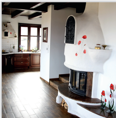
Jotul Panorama I18 – zabudowa wkładu w stylu wiejskim, parapet oraz boczne ścianki wykonane z trawertynu, kuta kratka wylotowa powietrzna, ręcznie malowany motyw florystyczny – mak. Do zabudowy wykonano pasujący stylistycznie okap kuchenny znajdujący się w tym samym pomieszczeniu.